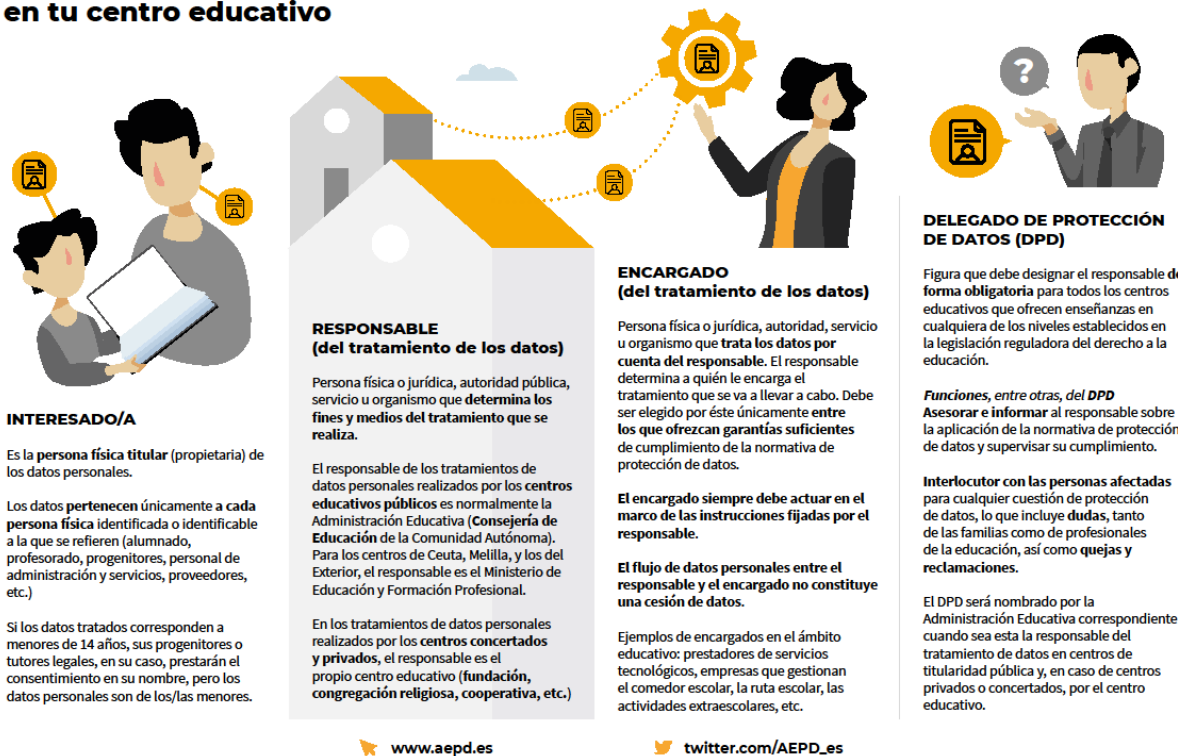
Figura 3. “Quién es quién en el tratamiento de datos personales de tu centro educativo”. AEPD, Agencia Española de protección de datos. https://www.aepd.es/es/guias-y-herramientas/infografías . Llicència CC BY-NC-SA 4.0